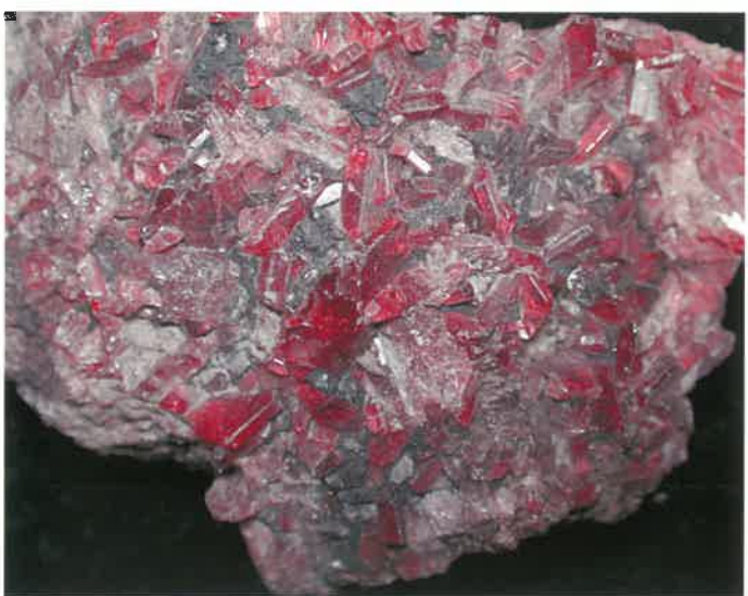
4. パイロクスマンガン石 (TMNR-1168)