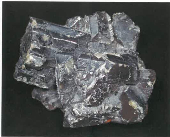
3. 閃亜鉛鋅 (TMNR-0863)