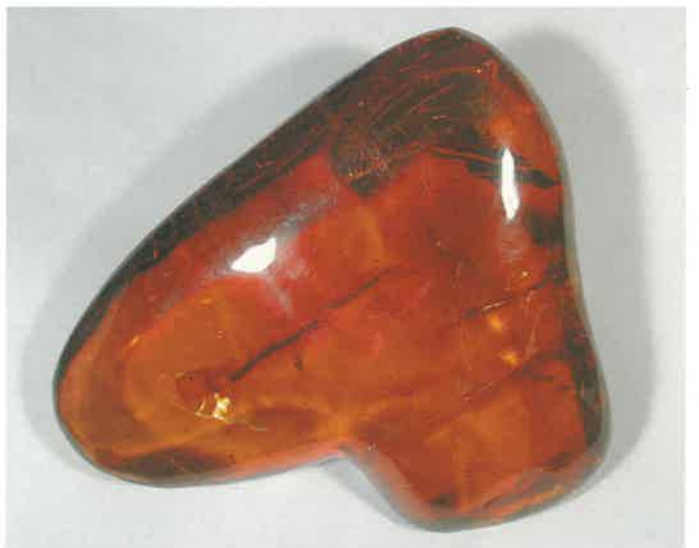
4. 琥珀 (TMNR-0765)