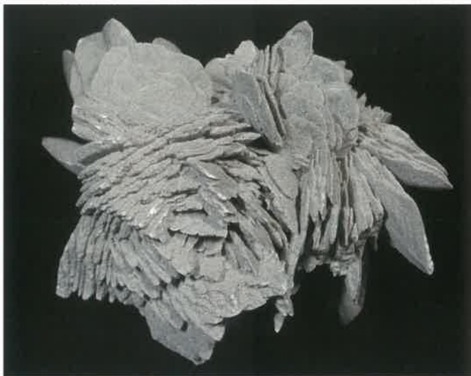
2. 砂漠のバラ (TMNR-0722)