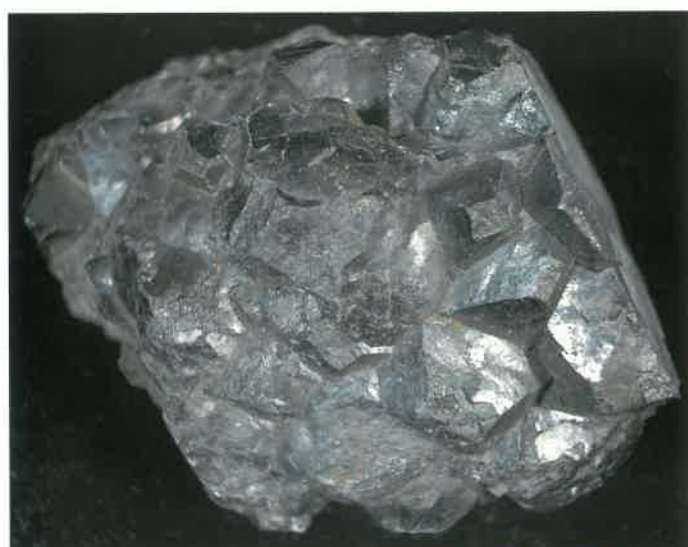
3. 磁鉄鉱 (TMNR-0847)