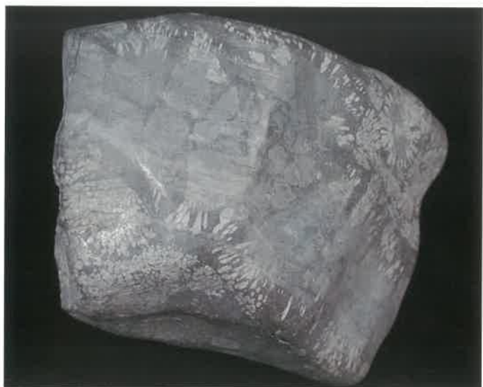
1. 菊花石 (TMNR-0695)