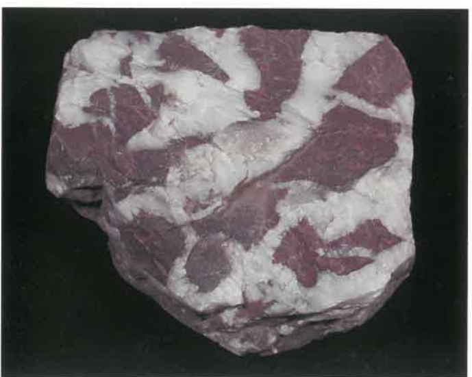
5. チャート (TMNR-0855)