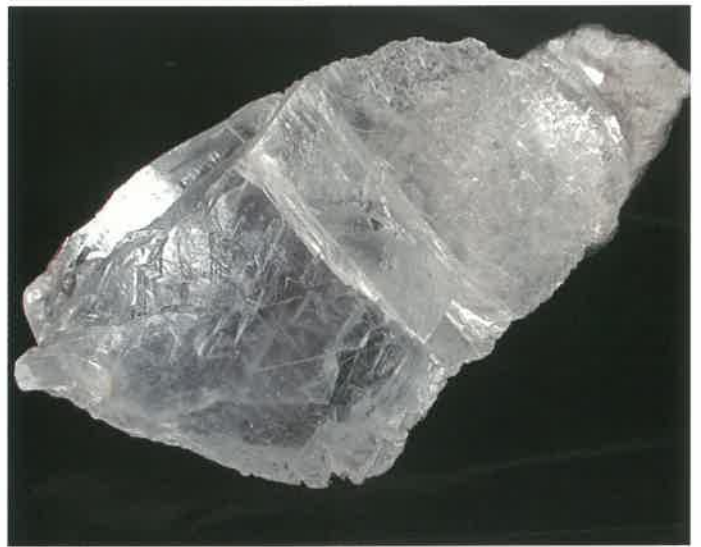
3. 石膏 (TMNR-1358)