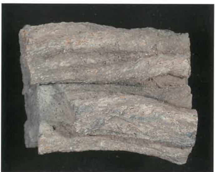
3. 縄状溶岩 (TMNR-0674)