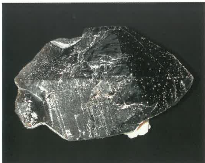
1. 黒水晶 (TMNR-0745)