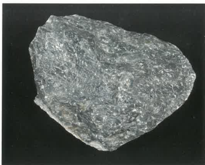
2. 松脂岩 (TMNR-0124)