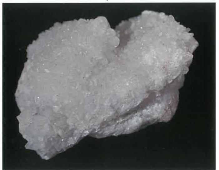
5. 灰硼石(コールマン石) (TMNR-0808)