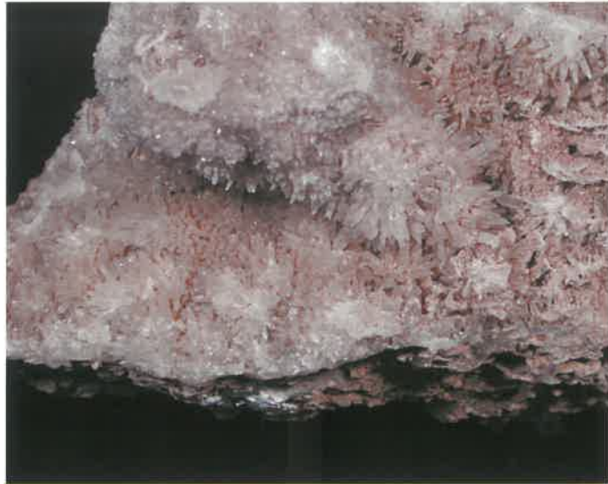
1. 鍾乳石 (TMNR-0665)