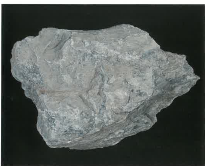
4. 蛇紋岩 (TMNR-0568)