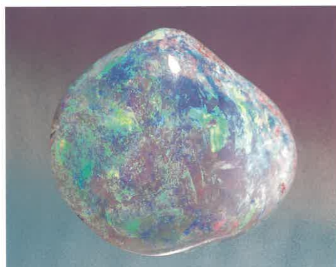
5. 蛋白石 (TMNR-1354)