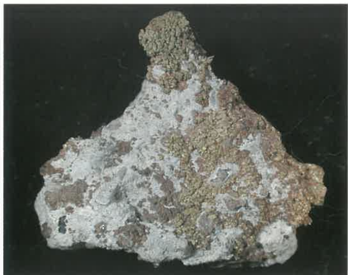
1. 自然金 (TMNR-0743)