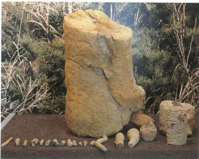
4. 高師小僧 (中央: TMNR-0593)