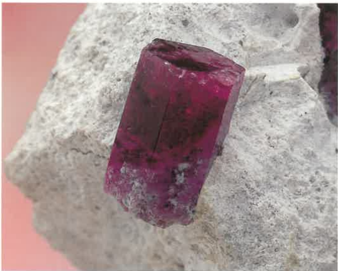
3. 緑柱石(レッド・ベリル) (TMNR-1331)