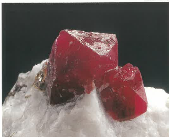
2. 鋼玉(ルビー) (TMNR-1301)