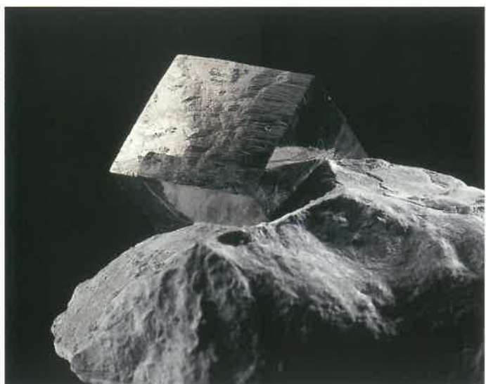
4. 黄鉄鉱 (TMNR-1105)