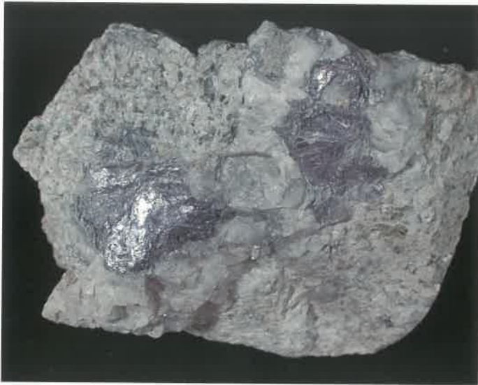
1. 輝水鉛鋅 (TMNR-0994)