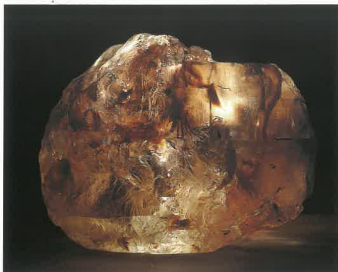
2. 黄玉(トパーズ) (TMNR-1328)