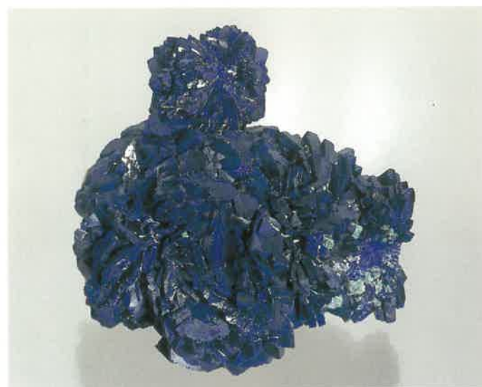
6. 藍銅鉱 (TMNR-0614)