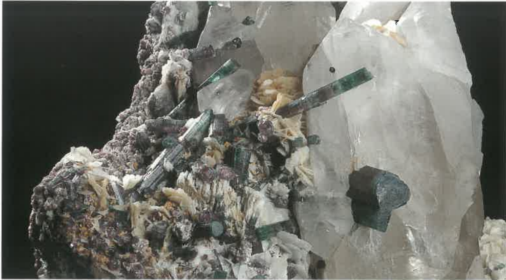
1. 电气石(バイカラータイプ) (TMNR-0768)