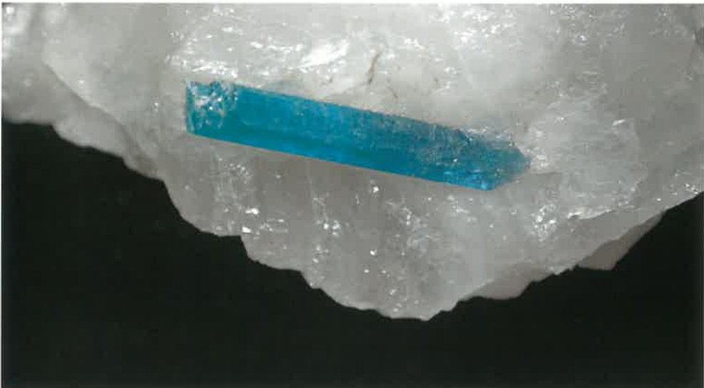
2. 电气石(パラタイプ) (TMNR-1372)