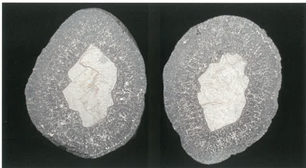
5. マンガン団塊 (TMNR-0594)