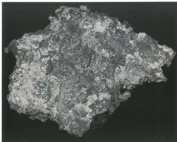
2. 自然銀 (TMNR-0757)