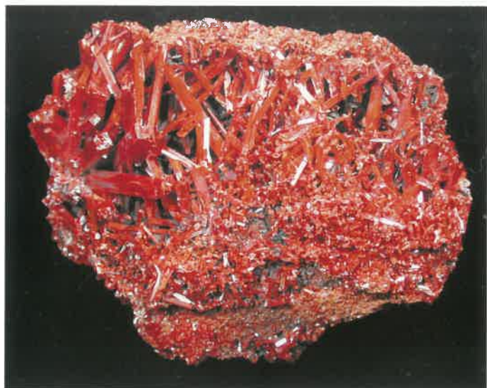
1. 紅鉛鉱 (TMNR-1369)