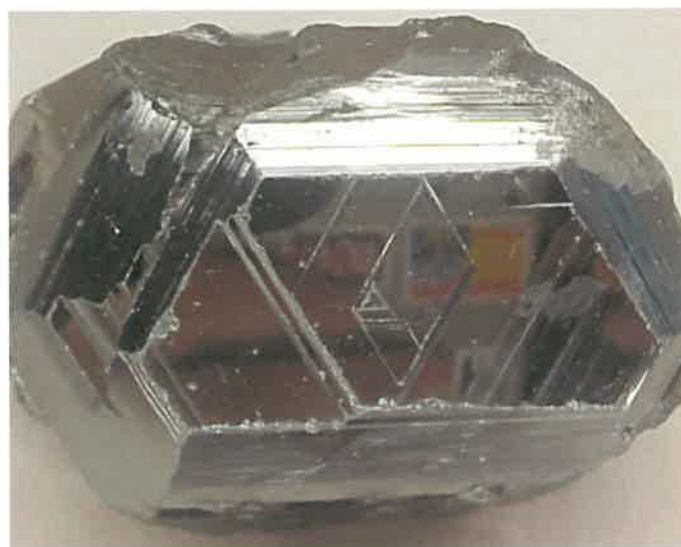
4. 赤鉄鉱 (TMNR-1370)