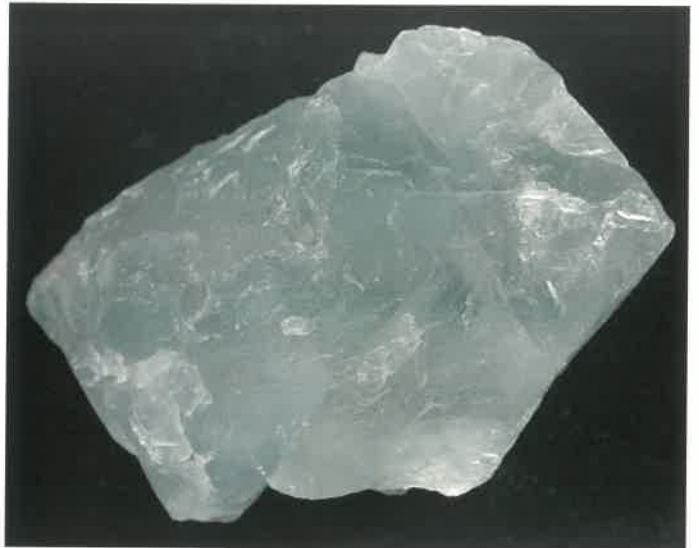
2. 螢石 (TMNR-0819)