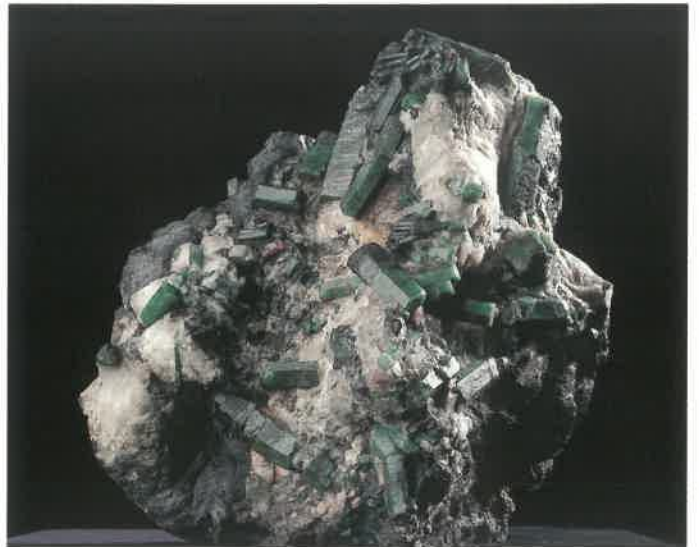
2. 緑柱石(エメラルド) (TMNR-1327)