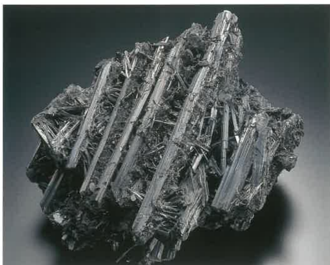
5. 輝安鉱 (TMNR-0613)