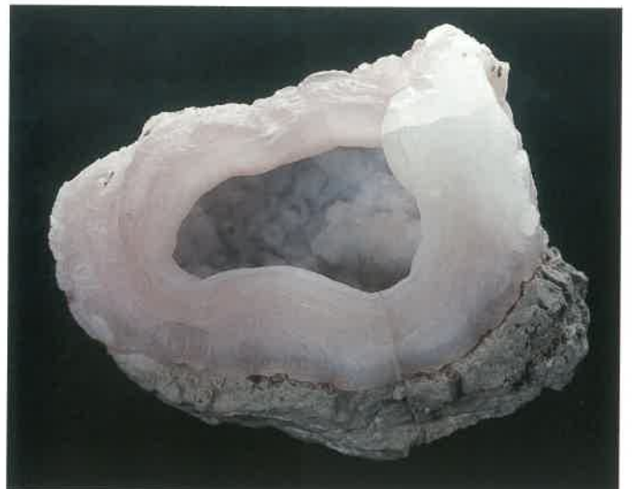
5. 玉髓 (TMNR-1238)