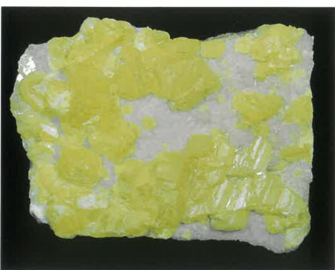
6. 硫黄 (TMNR-0091)