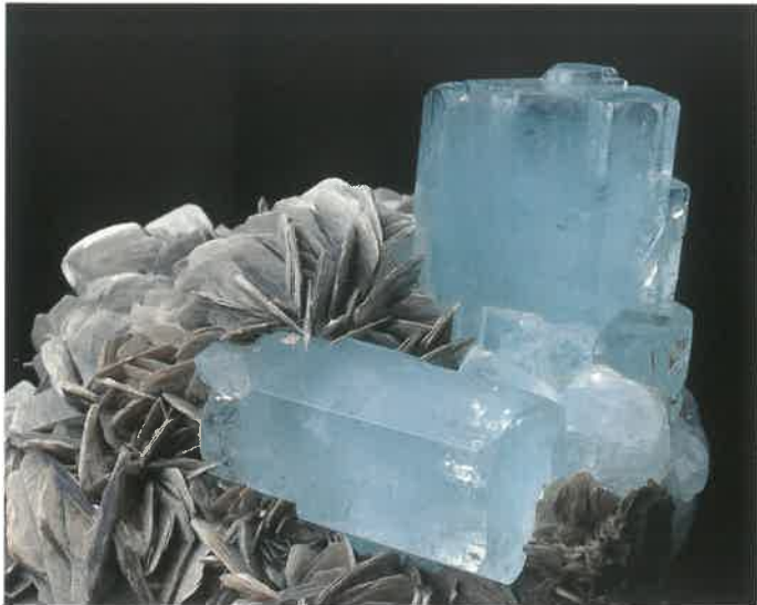
1. 緑柱石(アクアマリン) (TMNR-0767)