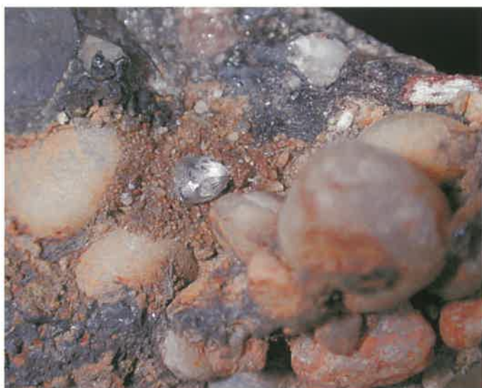
3. ダイヤモンド (TMNR-1373)