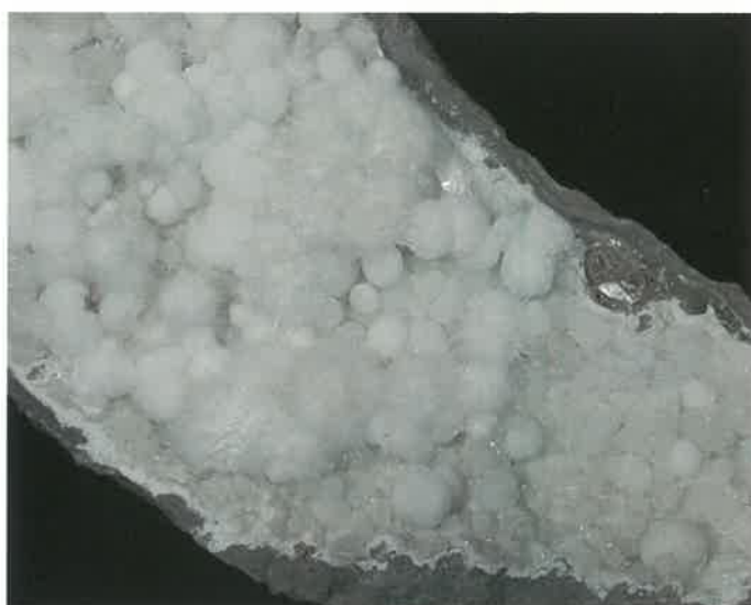
3. オーケン石 (TMNR-1212)