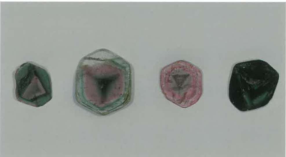
3. リディコート电气石 (TMNR-1371)