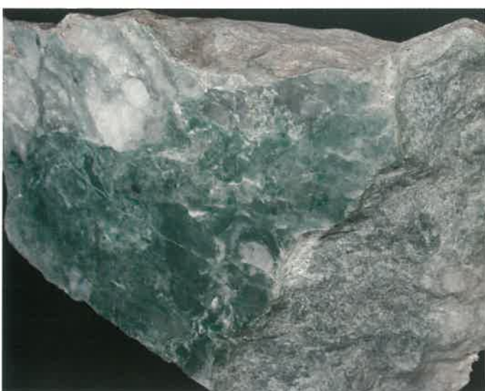
5. 翡翠輝石(硬玉) (TMNR-1307)